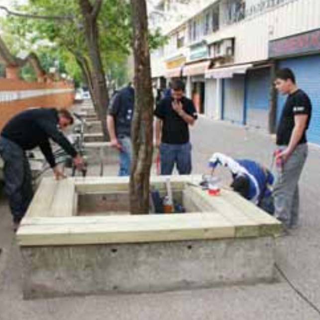
▲ Joves del Taller “D de moto” treballant en l’ajardinament dels parterres.