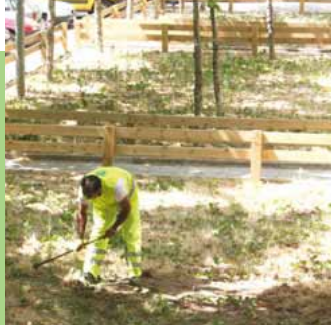
▲ La Brigada de Manteniment de la Mina realitza feines de neteja dels jardinetes del carrer Orient