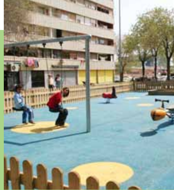
▲ Parc infantil de la Rambla Camarón