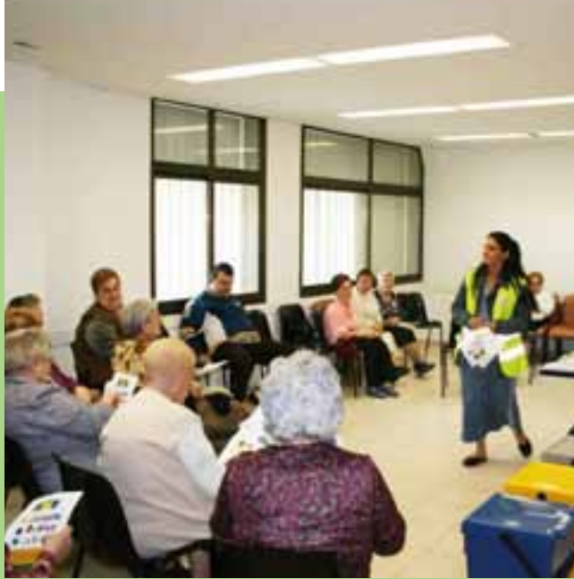
▲ Xerrada al Casal d'avis de la Mina a càrrec de les noies del PIM el passat 30 de març